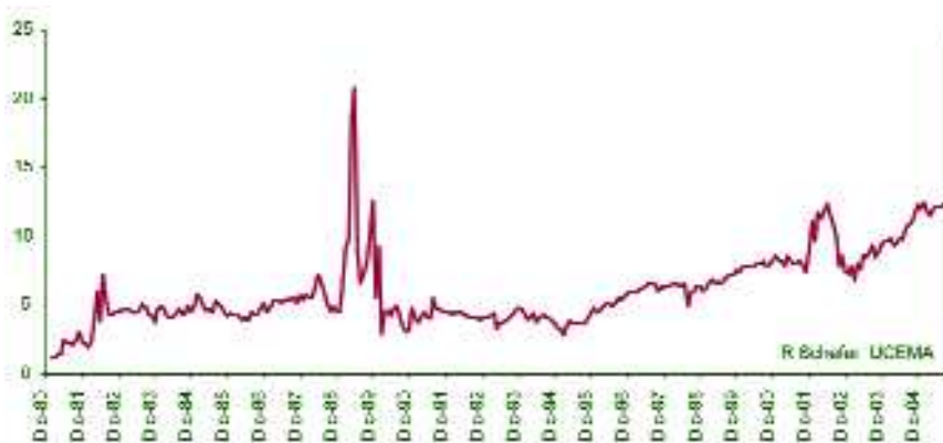
Tabla y gráficos: Elaboración propia en base a datos de: Ambito Financiero, BCRA, Bolsa de Comercio de Buenos Aires, Federal Reserve Board, GFMacroeconomía, Ministerio de Economía – Infoleg

Las bases de datos están disponibles http://ucema.edu.ar/~ras/basededatos.htm