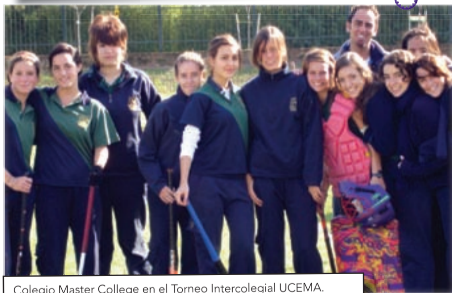
Colegio Master College en el Torneo Intercolegial UCEMA.