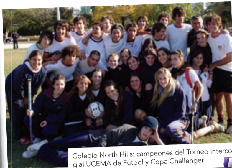
Colegio North Hills: campeones del Torneo Intercolegial UCEMA de Fútbol y Copa Challenger.