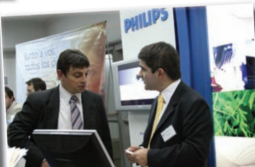
Día de la Empresa: evento anual donde alumnos y graduados tienen contacto con el área de Recursos Humanos de prestigiosas empresas.