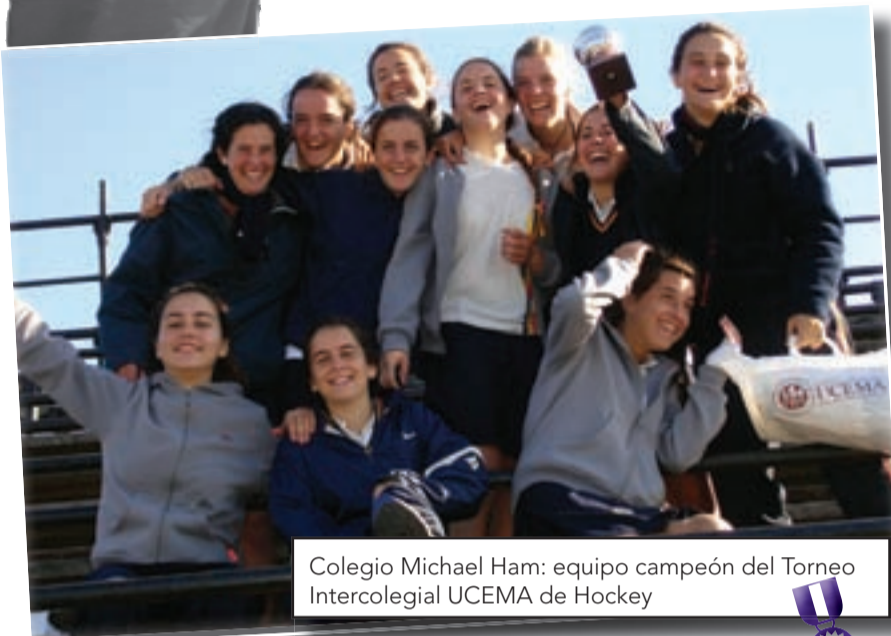
Colegio Michael Ham: equipo campeón del Torneo Intercolegial UCEMA de Hockey