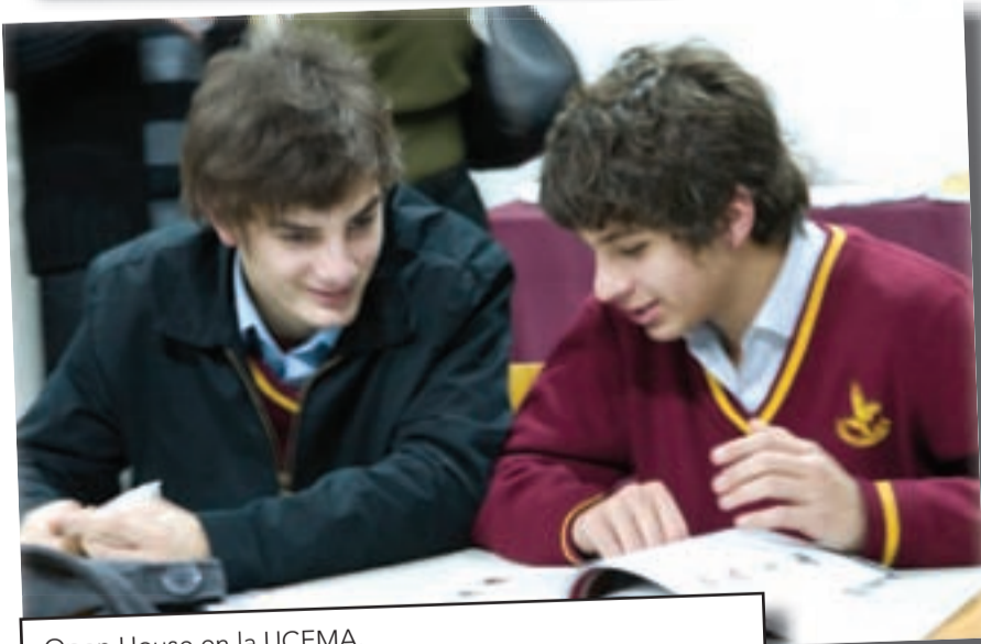
Open House en la UCEMA.