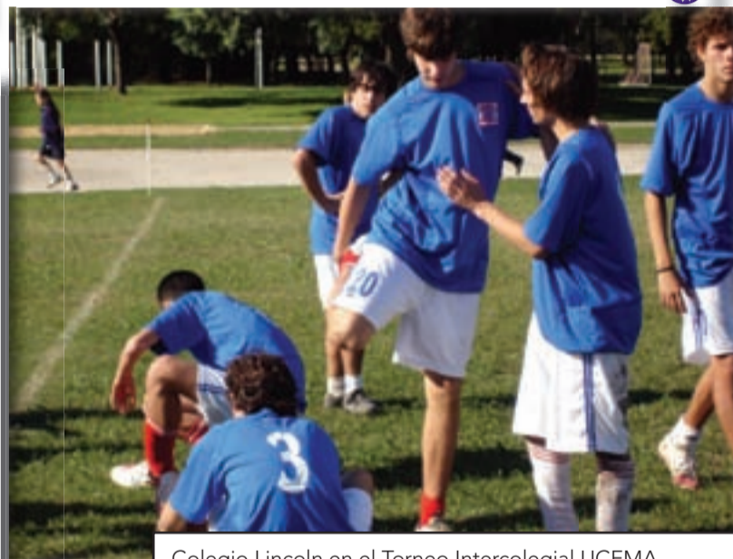
Colegio Lincoln en el Torneo Intercolegial UCEMA.