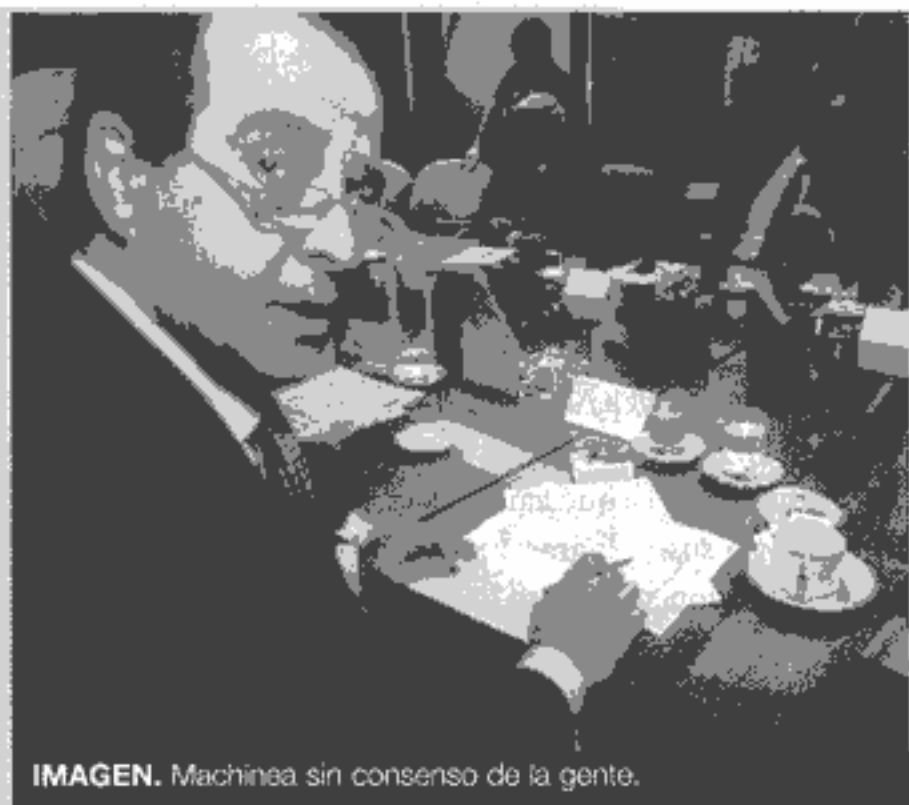
IMAGEN. Machinea sin consenso de la gente.

Si comparamos estas cifras con las publicadas por el Centro de Estudios Unión para la Nueva Mayoría en el mes de febrero, el ministro de Economía tenía una imagen negativa del 14% contra un 31% a su favor. Su gestión en ese periodo, según un informe de Hugo Jaime y Asociados , era considerada muy buena por un 20% y muy mala por un 17%.